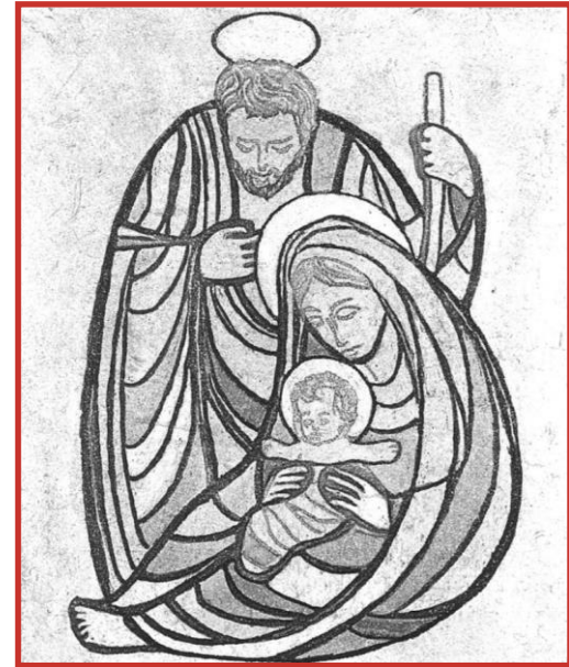
F. Oppezzo "Sacra Famiglia"

feriale e prefestiva ore 16,00 // festiva ore 11,30